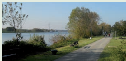
Radweg am Mainufer