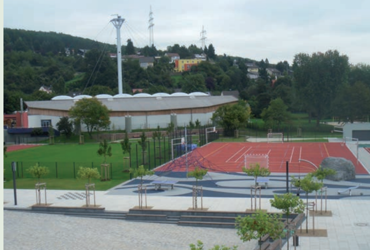
Freisportanlage zwischen der Grundschule und dem VITAMAR

Eine optimale und zukunftsorientierte Betreuung für Kinder, Ältere oder Pflegebedürftige und ihre Angehörigen bietet die Haus St. Vinzenz von Paul GmbH – soziale Dienste Kleinostheim. Weitere Einrichtungen wie die Neubauten für die Grundschule und die Kinderkrippe, die Musikschule, die Kindergärten, das Jugendhaus Pumphaus, die Katholische öffentliche Bücherei und die Freizeitanlagen runden das Spektrum der vielfältigen Möglichkeiten in Kleinostheim ab.