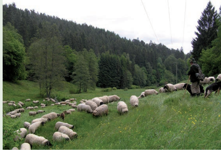
Aubachtal im Naturschutzgebiet Spessartwiesen