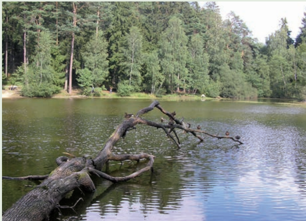
Naturidylle am Wiesbüttsee

Wiesen wurde bereits im Jahr 1336 erstmals urkundlich erwähnt. Die Besiedlung ist höchstwahrscheinlich durch den Kreuzungspunkt der bedeutenden mittelalterlichen Handelsstraßen „Birkenhainer